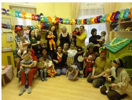
Táborozás –Magyarkút (15 család 24 gyermekkel)